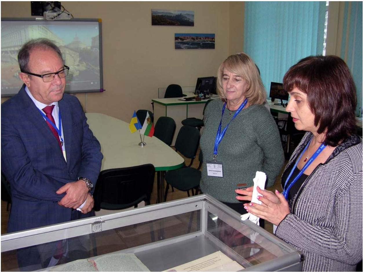
Гості завітали також до Центру «Вікно в Америку»