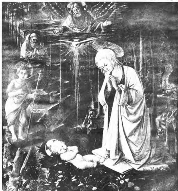
Поклонение Младенцу Христу.

ИЛЛЮСТРИРОВАННОЕ ПРИВАВЛЕНИЕ КЪ № 12459.