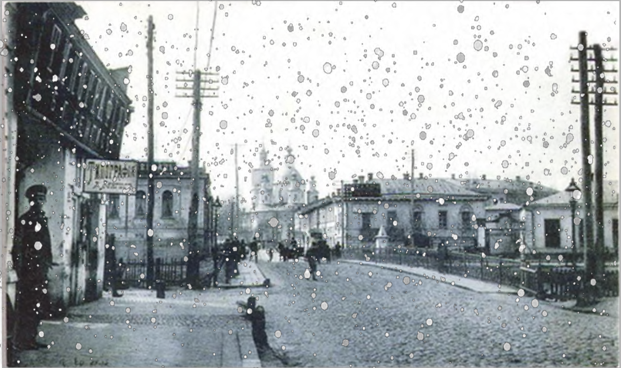
Готель «Версаль» Вул. Краснооктябрська, 1 (зараз Конторська) Арх. Цауне Ю.С. (початок ХХ століття)