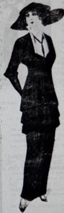
Модное платье из шерстяной ткани красного цвета.

Увеселений лихорадке Не поддавался я на святки Но как-то раз на детский бал Я в клуб коммерческий попал Там дети долго так плясали, Что даже спать и падаль стали... Еще-бы: умных матерей Увидел я на этом бале, Что чуть-ли ни грудных детей На этот бал с собою взяли – И далеко за полночь там Такие дети там зевали И подражая взрослым, – нам, С серьезным видом танцовали... Я этих детских вечеров Не подвергаю остракизму И даже посмотреть готов На них сквозь розовую призму, Когда там юный гимназист Или безусый реалист, Забыв учебников страницы, Охватив талию девицы Таких же лет, как и он сам, Отдастся грезам и мечтам И в вихре вальса унесется, –