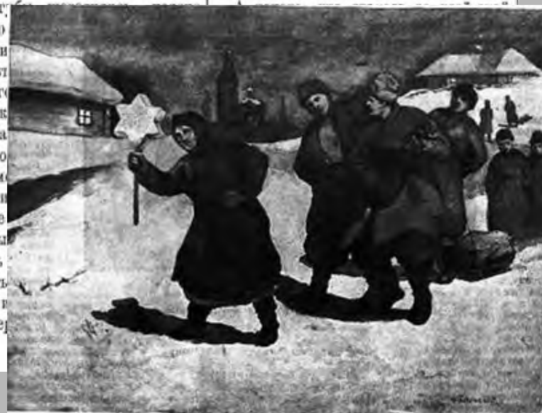
„Со звѣздой“. Рисунъ И. Воронькаго.

въ дивныя созданія поэзіи. Кто помнитъ старое время, тотъ не можетъ не согласиться, что всѣ эти Оксаны, Маруси, Ганны дѣйствительно жили, любили и страдали. Кто родился въ Малороссіи, тотъ, вѣроятно, и до сихъ поръ слышитъ мысленнымъ ухомъ своимъ чудные меланхолическіе напѣвы своей няни, напѣвы, которые, быть можетъ, ублаживали его.