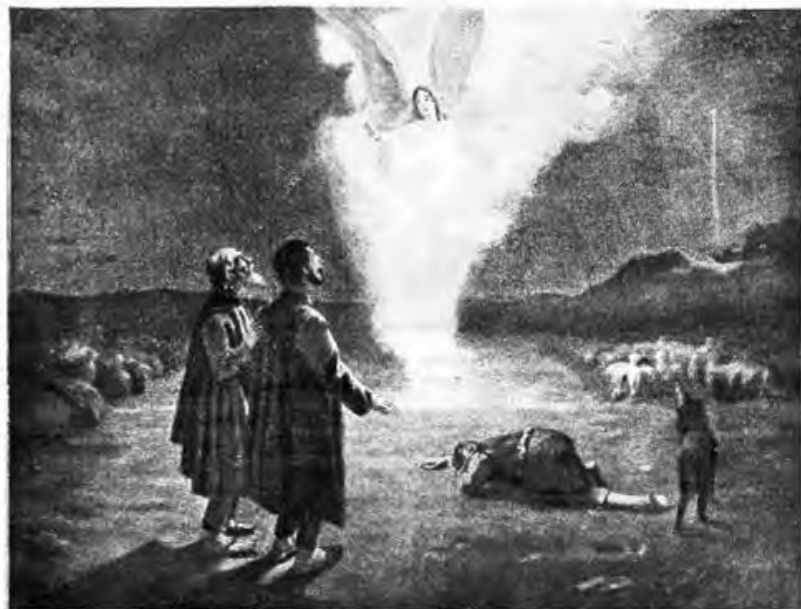
„Христосъ рождается .“

ИЛЛЮСТРИРОВАННОЕ ПРИБАВЛЕНИЕ КЪ № 10517.