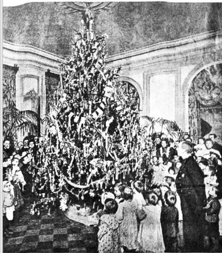
Елка для бедныхъ дѣтей.