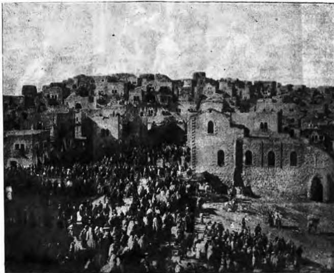
Видедемъ въ день праздника Рождества Христова.

— Кто там, Ванда? — Барыня со второго этажа... Элька смотрела на горничную с изумлением, не выпуская из правой руки воскового китайца, а изъ д'явой—красной нитки. — Барыня со второго этажа?.. Ты съ ума сошла?.. — Да ей-Богу же... уже разд'ялись... Гонорять, имъ нужно вид'ть васъ... спрашивали у меня, гд' д'ти и бонна... — Ну? — Я отв'тила, что д'ти у'хали къ бабушк' съ бонной... баринъ д'лаетъ визиты, а вы украшаете елку... Они сказали—идите, доложите обо мн'... Элька колебалась, потомъ сд'лала гримаску. — Хорошо... Впустите ее... И потушите электричество въ столовой... в'дь, еще совс'мь рано... четыре часа... — Это не я зажгла, а няня... — И напрасно... Маленькая, б'локурая женщина съ фарфоровымъ личикомъ старательно прив'шивала китайчика къ липкой колючей в'тк'.