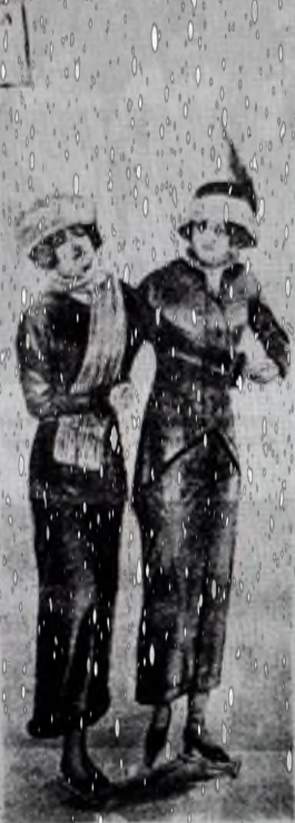
Одежды для катания на коньках.