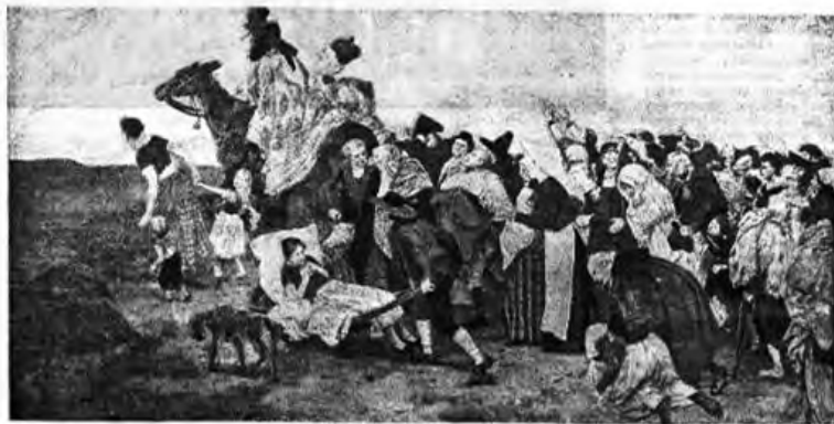
„Всѣ они слѣдуютъ за овцой“.