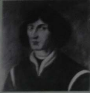
Портрет Миколая Коперніка на содзянкіху в Страсбуржскелу сабур. 1675. АРАМ. ЗФ II-131. к. 1