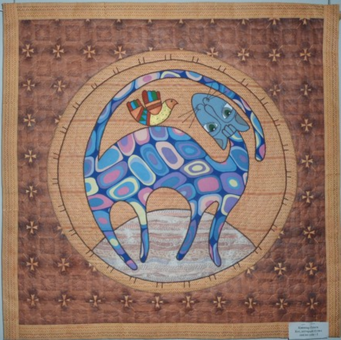
Quilted artwork Kari, 2019 100% cotton