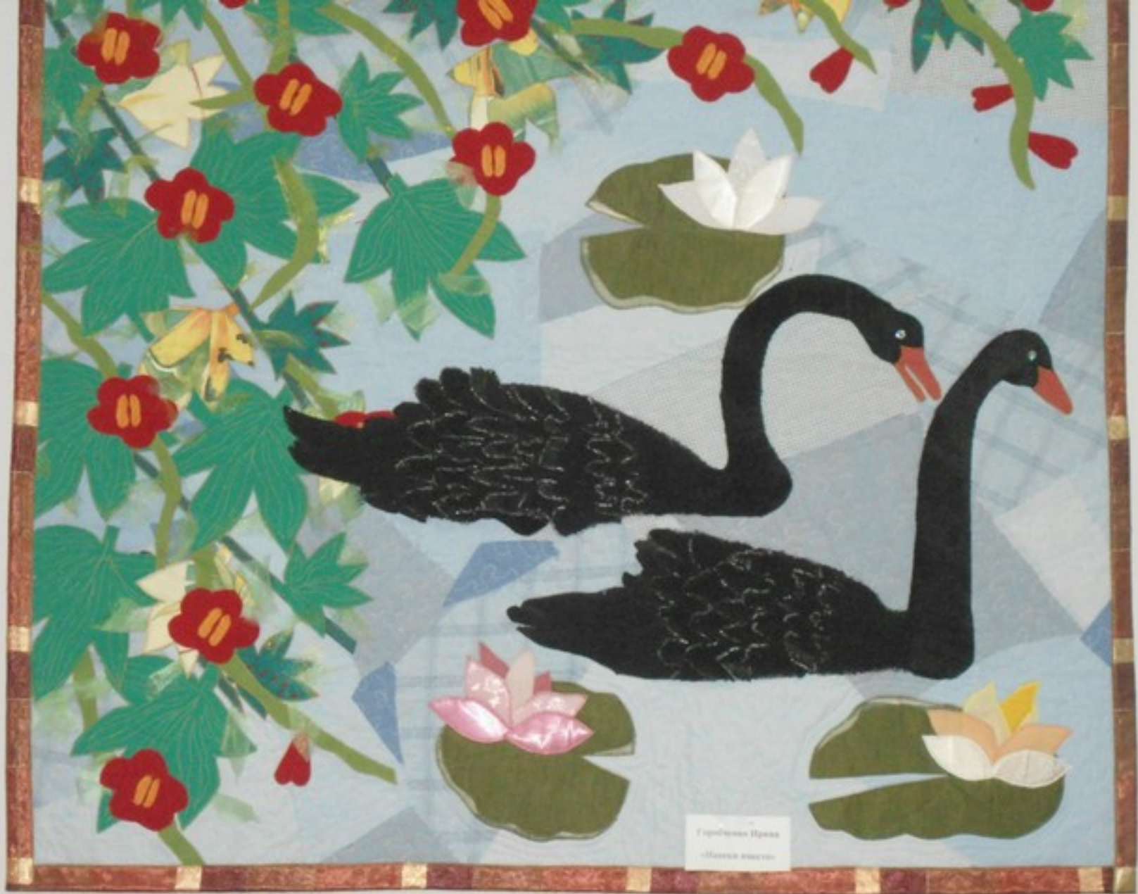
Горькая Пруда «Летняя сказка»