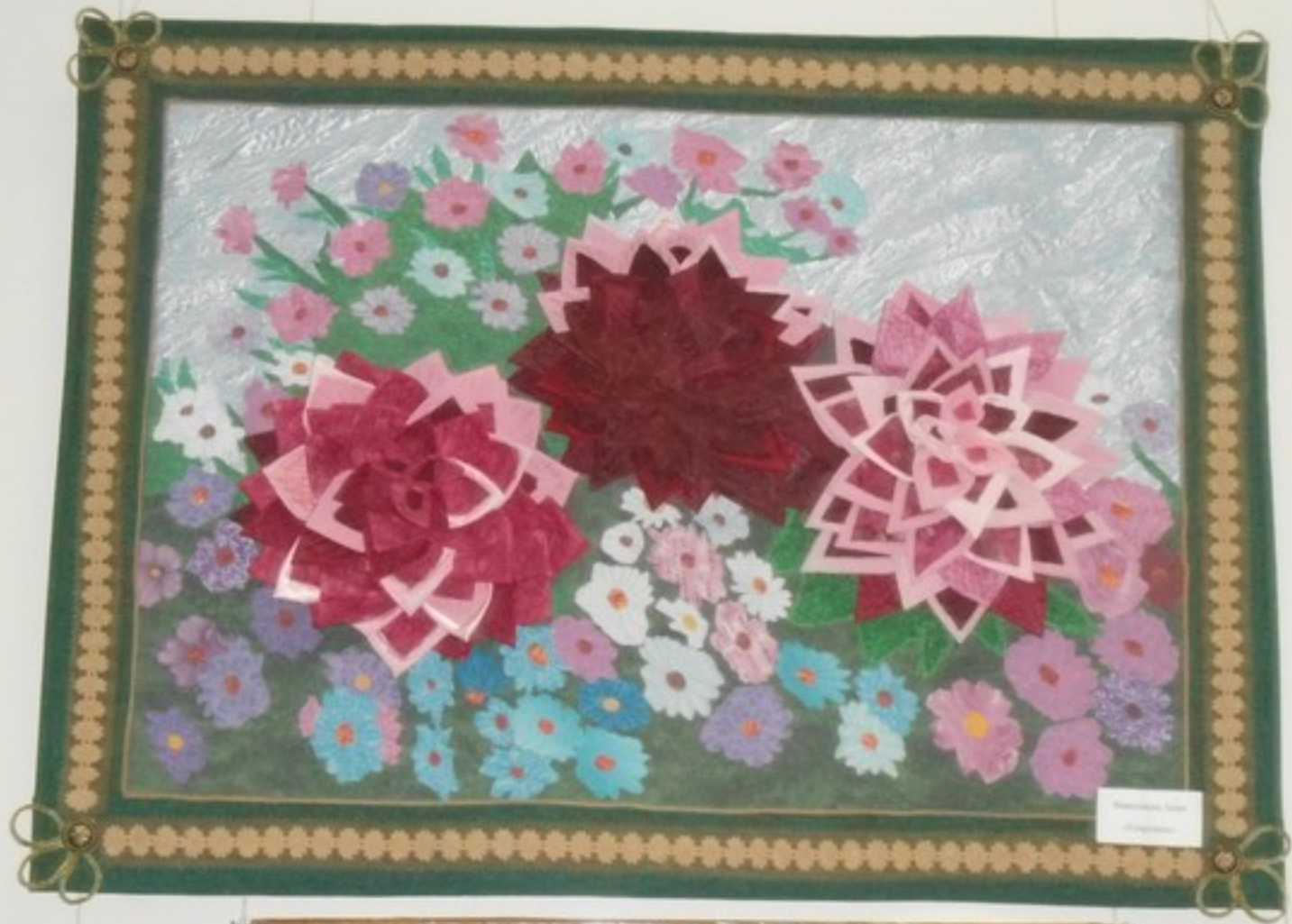
Floral Quilt by [Name]