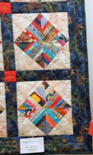
Quilted Panel by [unreadable]