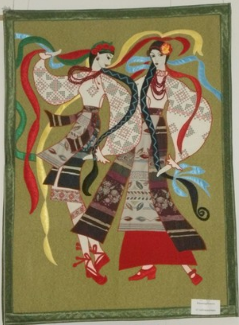
Two women in traditional attire with long flowing ribbons