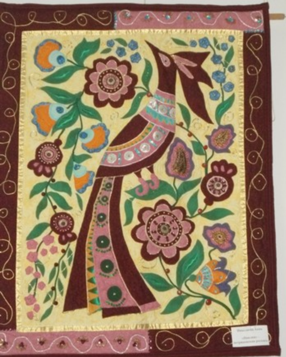
Stylized bird and flowers folk art style