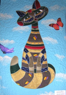
10 The Siamese Cat -Mona Lisa