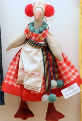
Stuffed Duck by [unreadable]