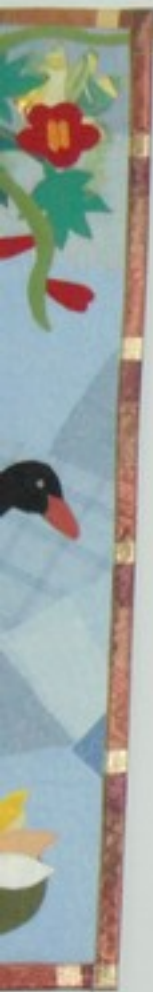
White and Red © 2000