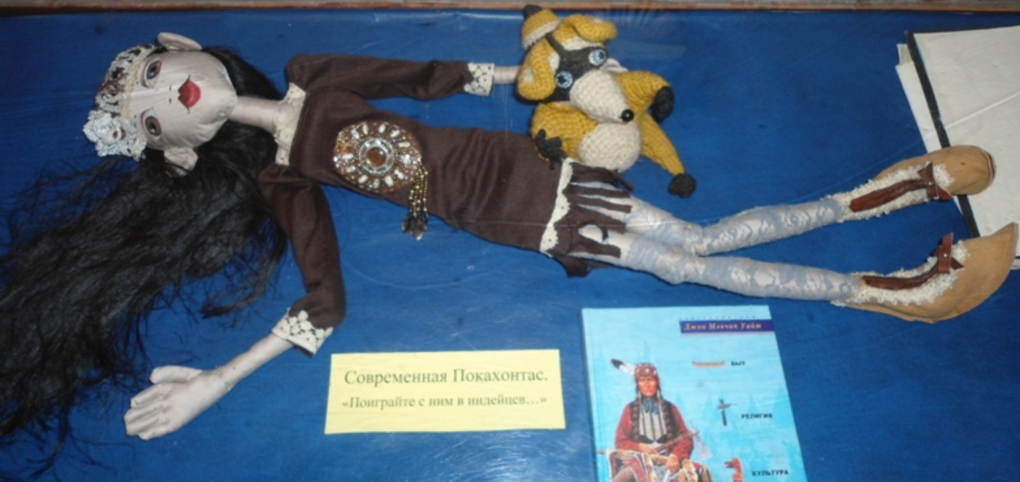
Современная Покахонтас. «Попрошайте с ним в индейцев...»